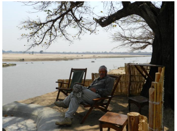
Посещение второго лагеря концессии.