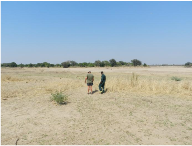
По следу слона. Следы ведут в национальный парк.