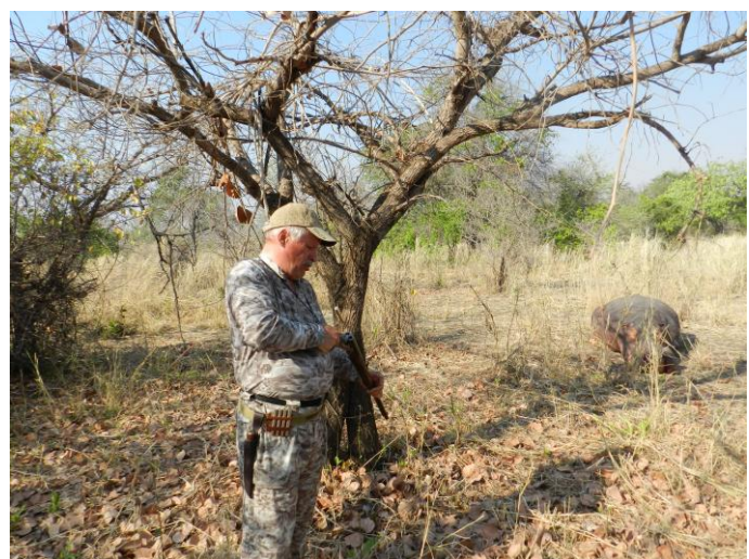
Момент. Гильза вылетает из штуцера.