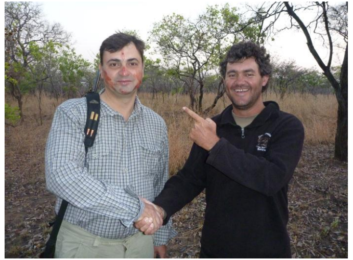
Посвящение в охотники.