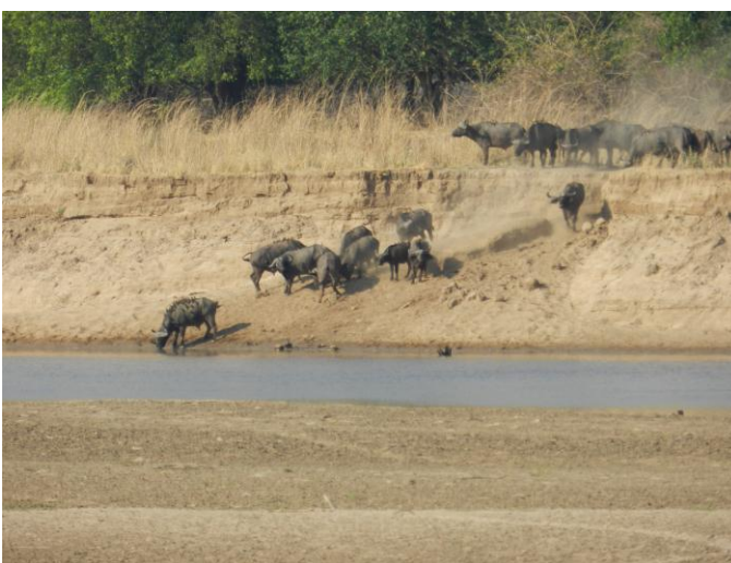
Стадо буйволов на водопое у реки.