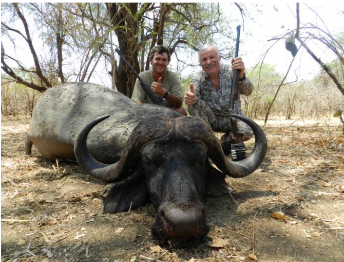
Два охотника. Первый трофей и первая проверка.